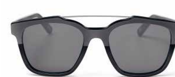
MINI MATT/SHINE AVIATOR SUNGLASSES.