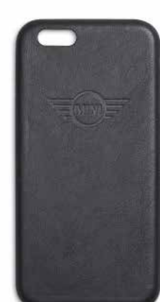
MINI PHONE COVER.

Número de parte: 80 21 2460921 iPhone 7/8 Número de parte: 80 21 2460922 iPhone 7/8 Plus Número de parte: 80 21 2445709 Samsung Galaxy 7