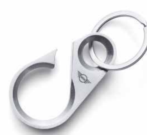
MINI BOTTLE OPENER KEYRING.