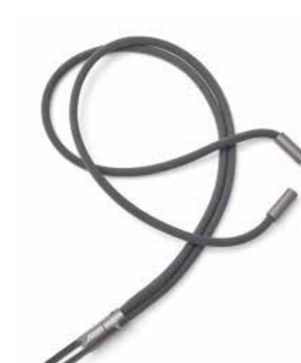
MINI TUBE LANYARD.