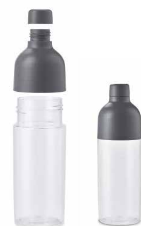
MINI COLOUR BLOCK WATER BOTTLE.