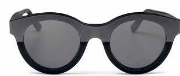
MINI MATT/SHINE PANTO SUNGLASSES.

Número de parte: 80 23 2460892-91 Número de parte: 80 23 2445722