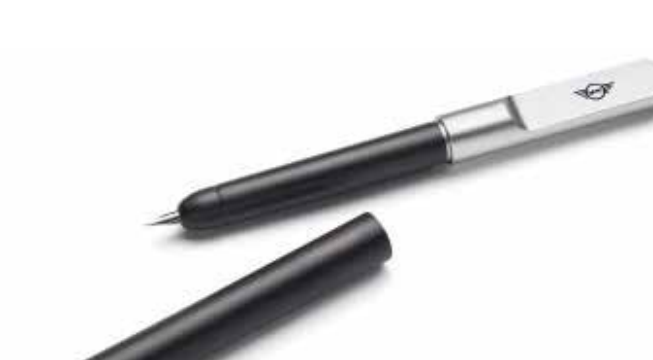
MINI FOUNTAIN PEN.