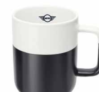
MINI COLOUR DIP CUP.