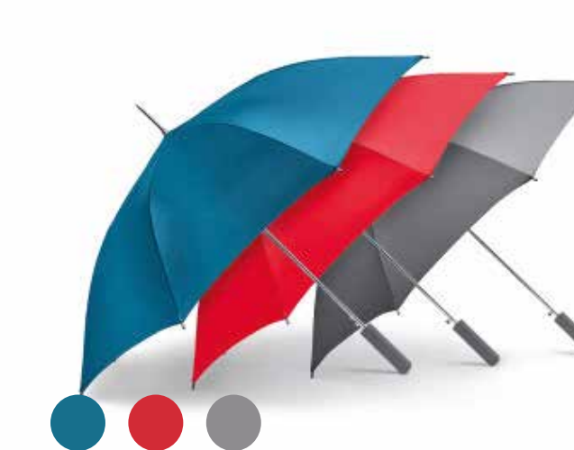
MINI WALKING STICK SIGNET UMBRELLA.

Número de parte: 80 23 2460889-90 Número de parte (grey): 80 23 2445719