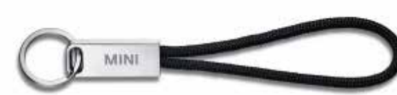
MINI WORDMARK KEYRING.