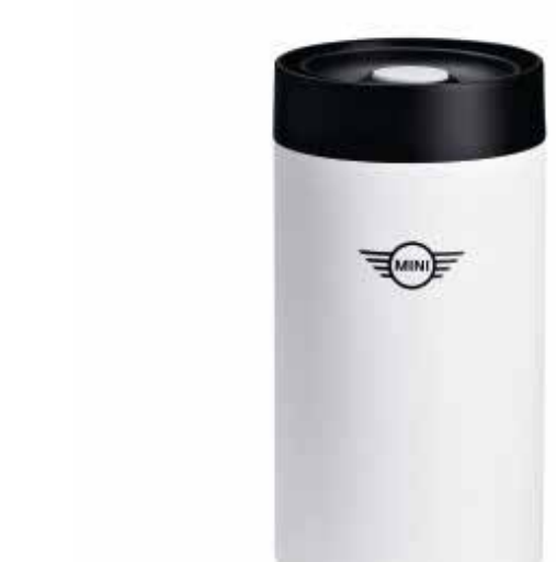
MINI TRAVEL MUG.

Número de parte (white): 80 28 2445702 Número de parte: 80 28 2460909-10