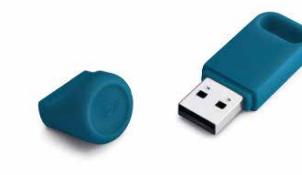
MINI USB KEY.

Capacidad: 32 Gb Número de parte (grey): 80 29 2445703 Número de parte: 80 29 2460899-98