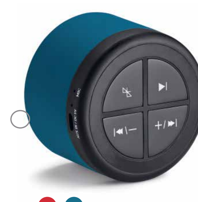
MINI BLUETOOTH SPEAKER.

Número de parte: 80 21 2460921 iPhone 7/8 Número de parte: 80 21 2460922 iPhone 7/8 Plus Número de parte: 80 21 2445709 Samsung Galaxy 7