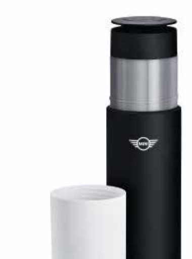
MINI TRAVEL FLASK.

Número de parte (white): 80 28 2445702 Número de parte: 80 28 2460909-10