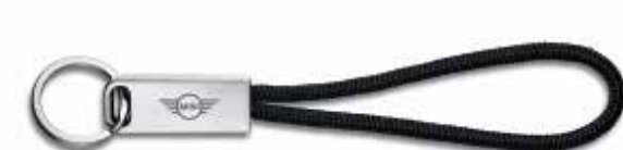
MINI WING LOGO KEYRING.