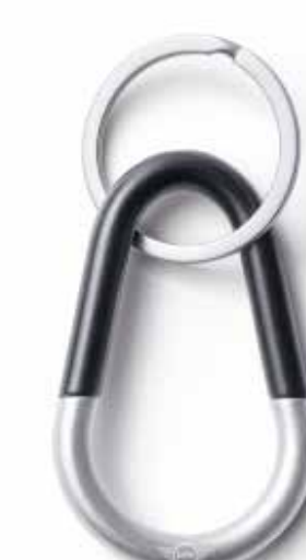
MINI COLOUR BLOCK KEYRING.