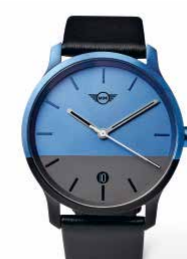
MINI COLOUR BLOCK WATCH.