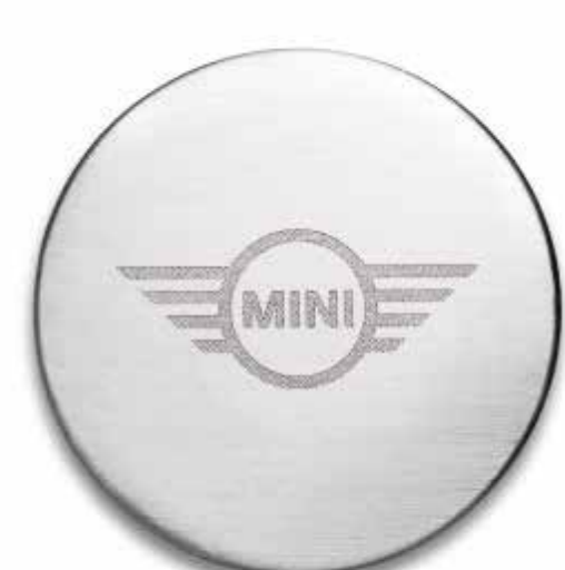
MINI WING LOGO MAGNET.